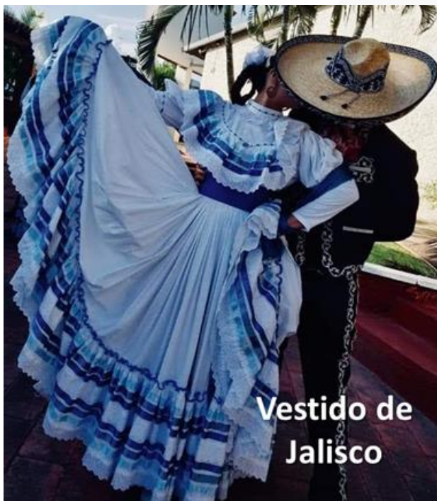
Vestido de Jalisco