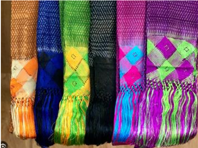
Faldilla o fondo