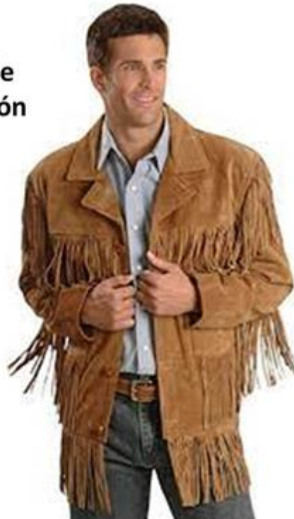
Cueras de Nuevo León